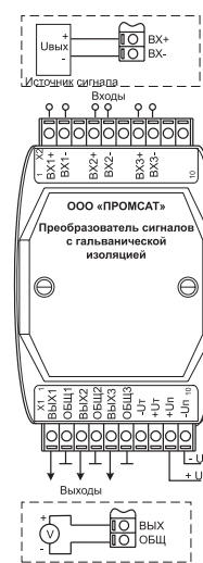
Схема подключения преобразователя PSA-01.XX.43.XX.XX