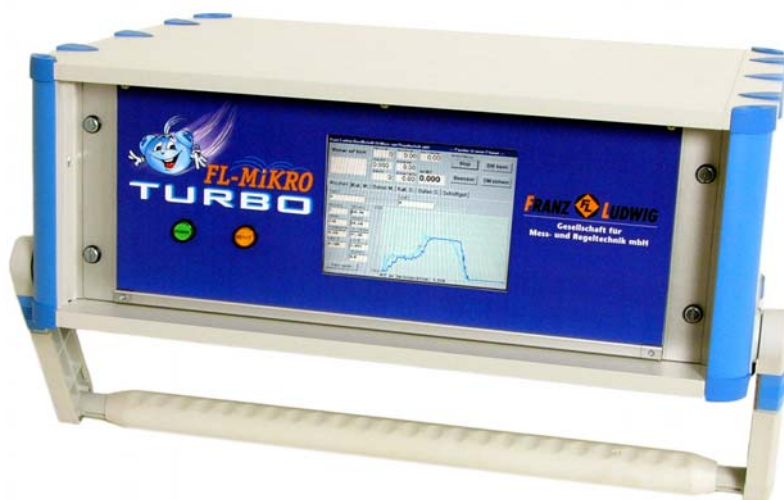
Схема установки FL-MIKRO-TURBO _____